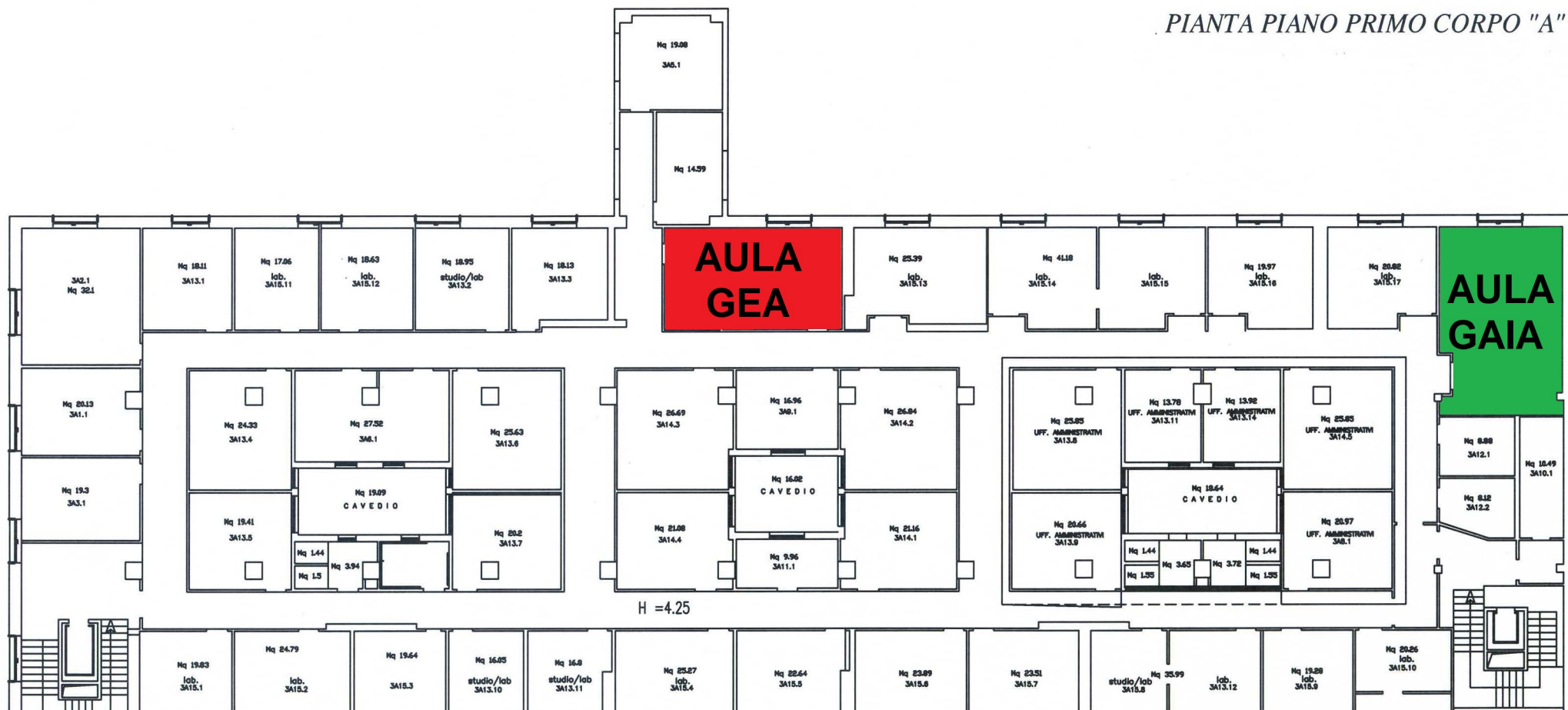
PIANTA PIANO PRIMO CORPO "A"

Dipartimento di Scienze e Tecnologie Ambientali Biologiche e Farmaceutiche