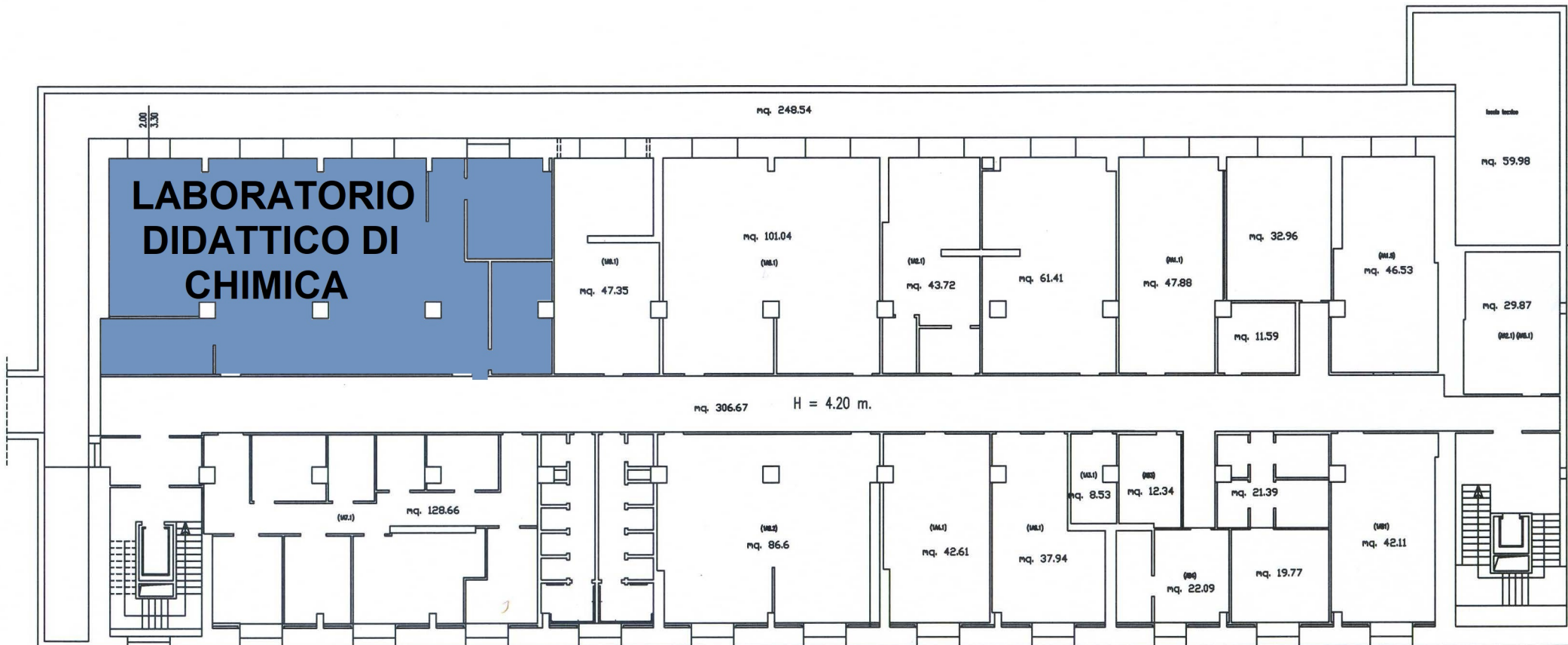
PIANTA PIANO SEMINTERRATO CORPO "A"

Dipartimento di Scienze e Tecnologie Ambientali Biologiche e Farmaceutiche